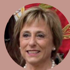
Sindaco Silvana Centurelli

Dal 2021 ad oggi il percorso impostato dall'Amministrazione Comunale si è rivelato corretto nella forma e nella sostanza. Anche in questa nuova fase dove ci troviamo ad interpretare il delicato ruolo di coordinatore dei rapporti tra gestore uscente e gestore entrante, con l'aggravio di un contenzioso pendente, stiamo ottenendo i risultati sperati. Ora confidiamo nella collaborazione tra le aziende per raggiungere l'obiettivo più importante: l'impianto di Trezzo funzionante, efficiente e ancora più rispettoso dell'ambiente.